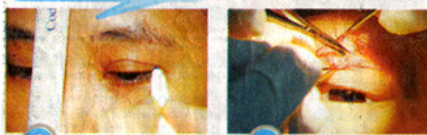
1 绘出双眼皮位置。一般上, 东方人的双眼皮距离睫毛处1至5毫米。