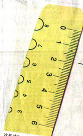
这是其中一小段从女病患发炎的角膜中所取出来的手术缝线。医生奉劝, 公众若要割双眼皮, 一定要找受过专业训练的医生操刀, 不然可能引发缝线插损角膜, 导致角膜发炎及肿痛等后遗症。