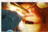
4 去除多余的肌肉及脂肪组织。