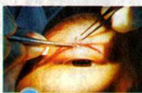
5 在提眼皮肌及眼皮之间缝线, 模拟出一条假纤维。