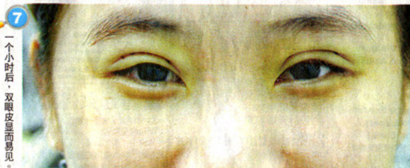
7 一个小时后, 双眼皮显而易见。

这名女病患曾在美容院接受双眼皮缝制手术, 不过为她操刀的美容师却把缝线缝得太深, 结果插到角膜。这名女生术后已感觉眼睛不舒服, 加上长年佩戴隐形眼镜, 结果角膜承受不了摩擦及拉扯压力, 继而发炎及红肿。