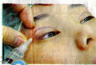
2 在双眼局部注射麻醉剂。